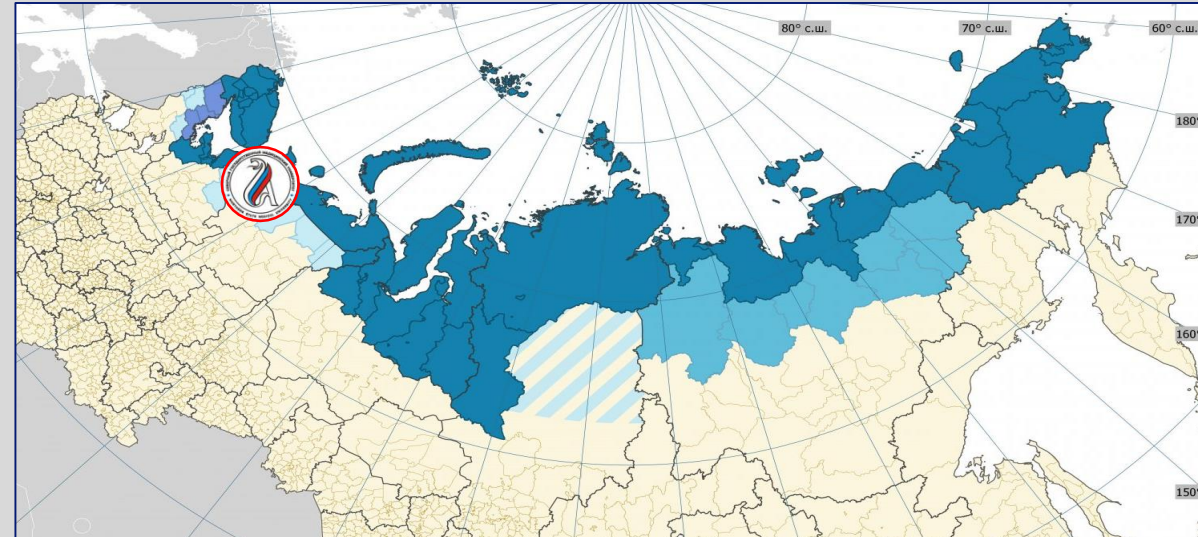
Северный государственный медицинский университет на карте Арктической зоны Российской Федерации

Цель программы «Приоритет-2030» – к 2030 году сформировать в России более 100 прогрессивных современных университетов - центров научно-технологического и социально-экономического развития страны.